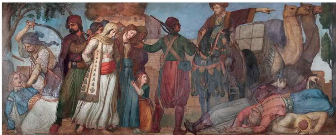
Ludwig Michael von Schwanthaler, Λεηλασία τῆς Πελοποννήσου ἀπὸ τὸν Ἰμπραήμ πασᾶ, τοιχογραφία, Βουλή τῶν Ἑλλήνων