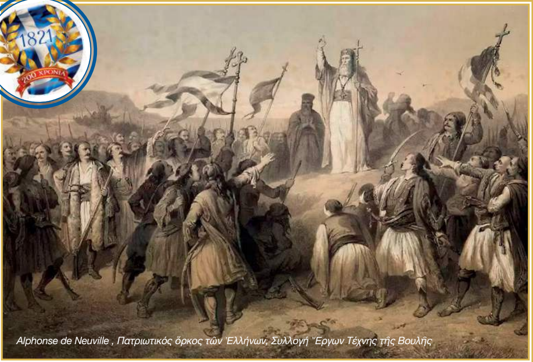
Alphonse de Neuville , Πατριωτικός όρκος τών Έλλήνων, Συλλογή Έργων Τέχνης τής Βουλής