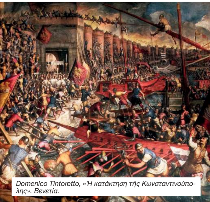
Domenico Tintoretto, «Η κατάκτηση της Κωνσταντινούπολης». Βενετία.