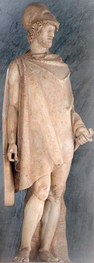
Φωκίων, Μουσείο Βατικανού.