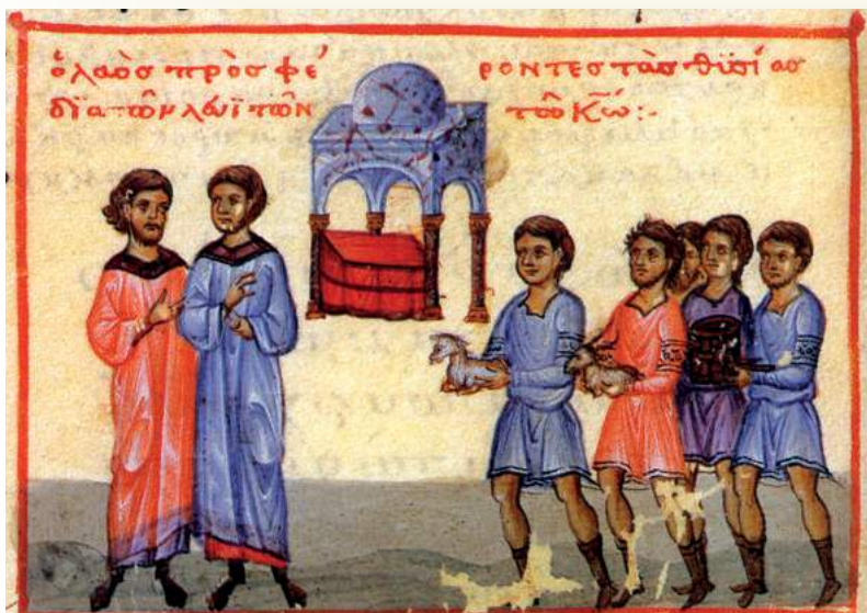
Ἁ λαός προσφέρει ὡς θυσία τὰ «πρωτογεννήματα τῶν ζώων» (κώδ. 602, φ. 158β)